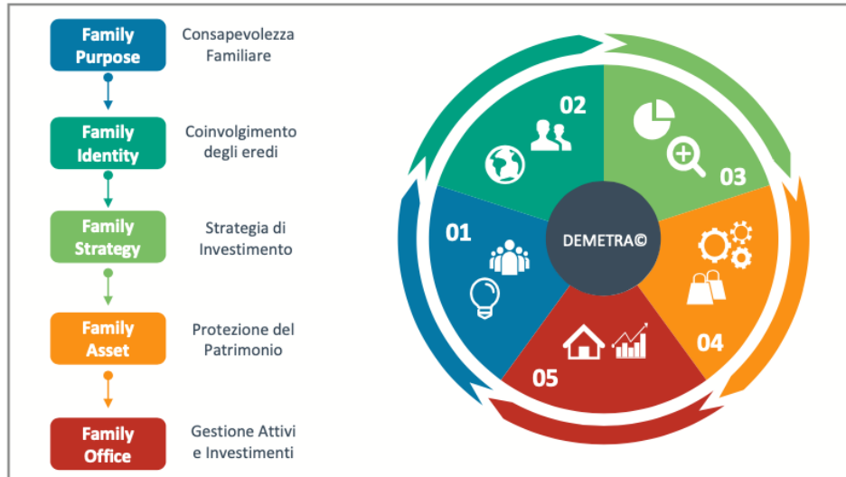
Metodologia Demetra@ Family Strategy